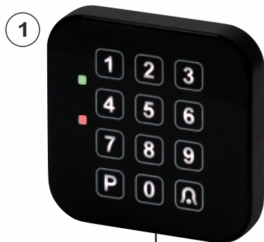
CTK - SW

Entrée : code programmable de max 8 chiffres