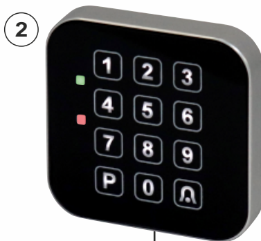
CTK - S